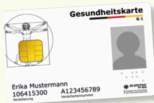
Musterbeispiel einer Gesundheitskarte

Bitte nehmen Sie immer Ihre elektronische Gesundheitskarte mit, wenn Sie Gesundheitsdienste in Anspruch nehmen. Seit dem 1. Januar 2015 gilt ausschließlich diese Karte als Berechtigungsnachweis, um Leistungen der gesetzlichen Krankenversicherung in Anspruch nehmen zu können. Auf der elektronischen Gesundheitskarte sind Ihr Name, Ihr Geburtsdatum und Ihre Anschrift sowie Ihre Krankenversicherungsnummer und Ihr Versichertenstatus (Mitglied, Familienversicherter oder Rentner) als Pflichtdaten gespeichert. Die elektronische Gesundheitskarte enthält außerdem ein Lichtbild von Ihnen.