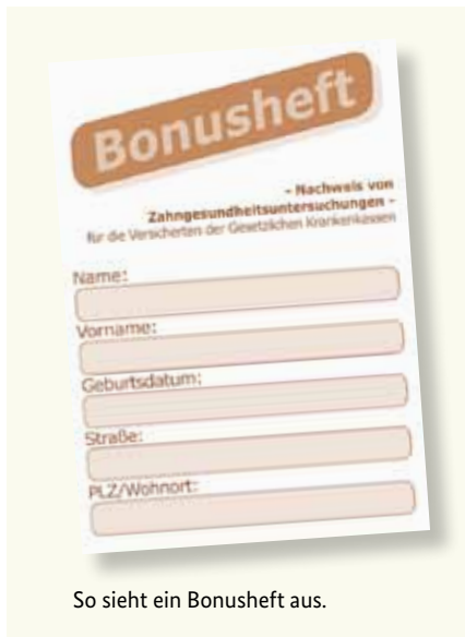
So sieht ein Bonusheft aus.

Gesunde Zähne sind ein Stück Lebensqualität. Deshalb sind regelmäßige Vorsorgeuntersuchungen wichtig – auch wenn Sie keine Beschwerden haben. Die gesetzlichen Krankenkassen übernehmen auch die Kosten dieser Vorsorgeuntersuchungen. Diese Untersuchungen helfen, bestimmte Erkrankungen frühzeitig zu erkennen und zu behandeln. Sie können dafür von Ihrer Krankenkasse ein sogenanntes „Bonusheft“ erhalten. In diesem Heft werden die Vorsorgeuntersuchungen eingetragen. Wenn Sie nachweisen können, dass Sie mindestens einmal im Jahr (unter 18 Jahren mindestens einmal pro Halbjahr) bei einer Zahnärztin oder einem Zahnarzt waren, zahlt die Krankenkasse einen höheren Zuschuss, sofern ein Zahnersatz notwendig wird.